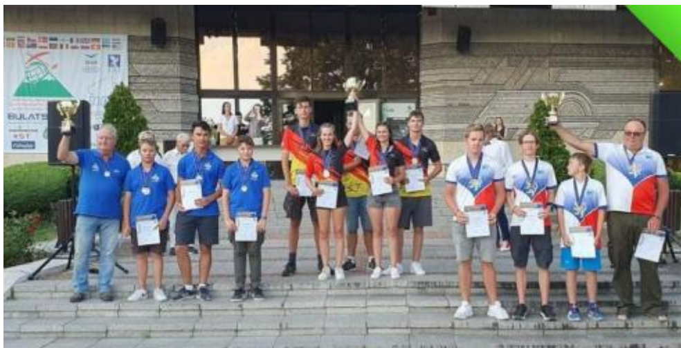
Championnats du monde Bulgarie