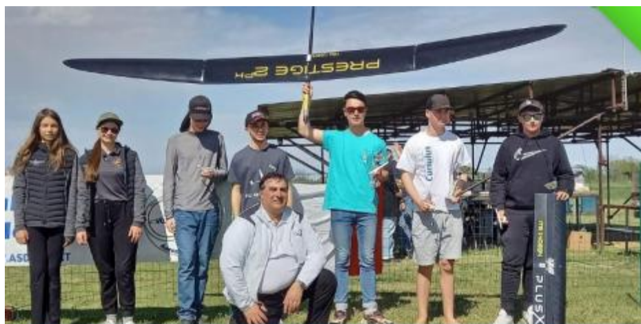
Eurotour F5J Italie